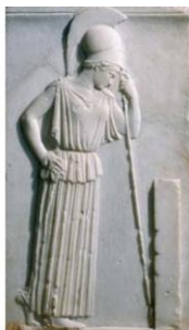
Athena pogrążona w żałobie, V w. p.n.e.